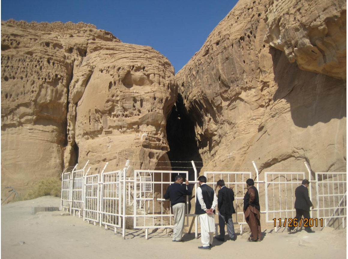
Ceelka Nabi Saalix Calayhissalaamu. Xasanwali 1433H/2011M..