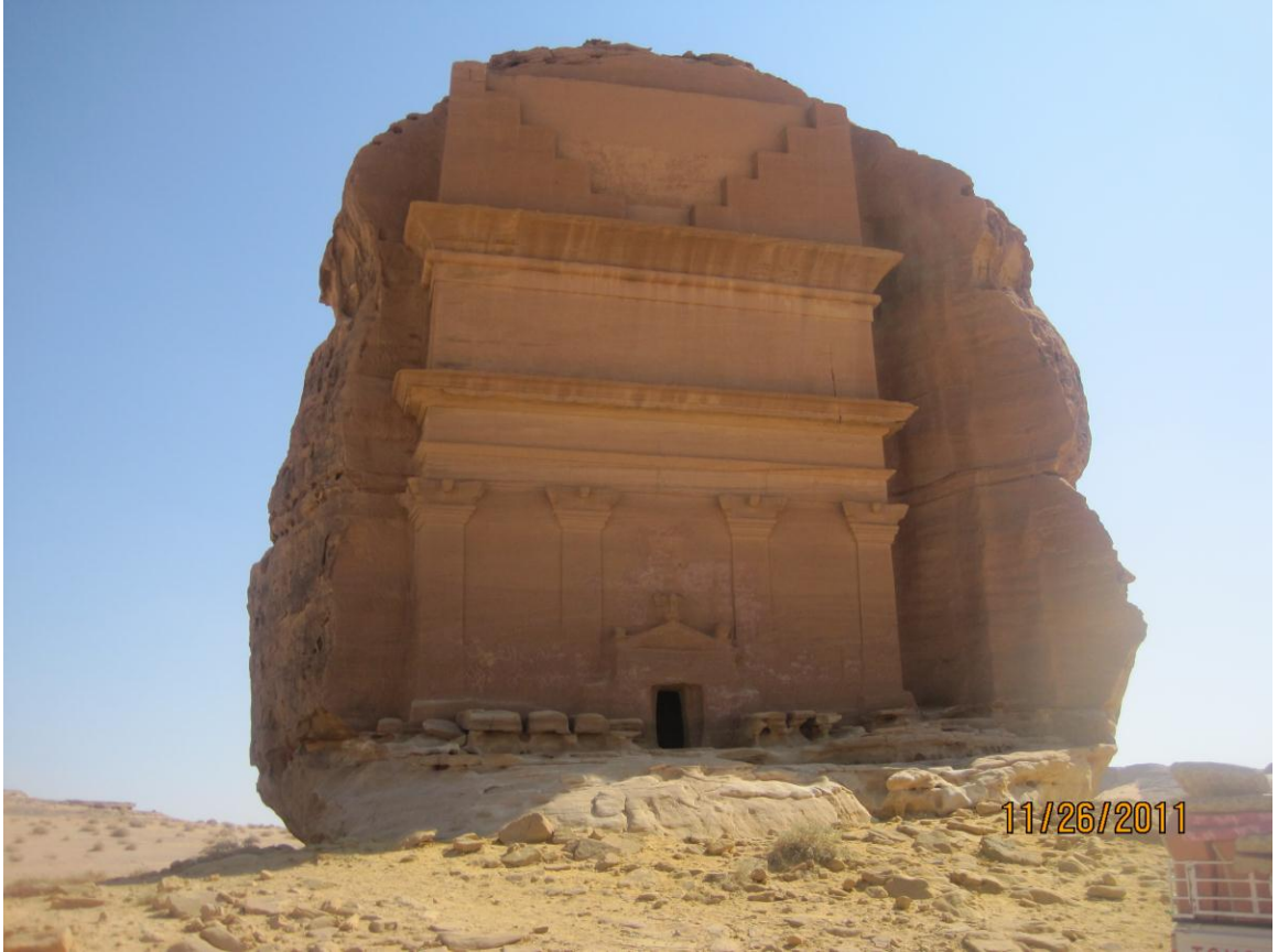
Qasru Al Fariidi ee Al Xijru. Xasanwali 1433H/2011M.