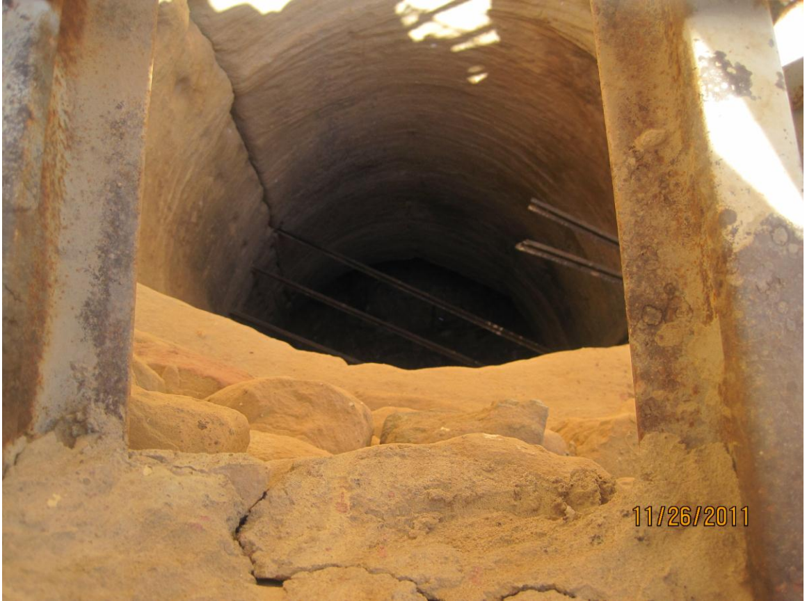
Ceelka Saalex ee Al Xijru. Xasanwali 1433H/2011M.