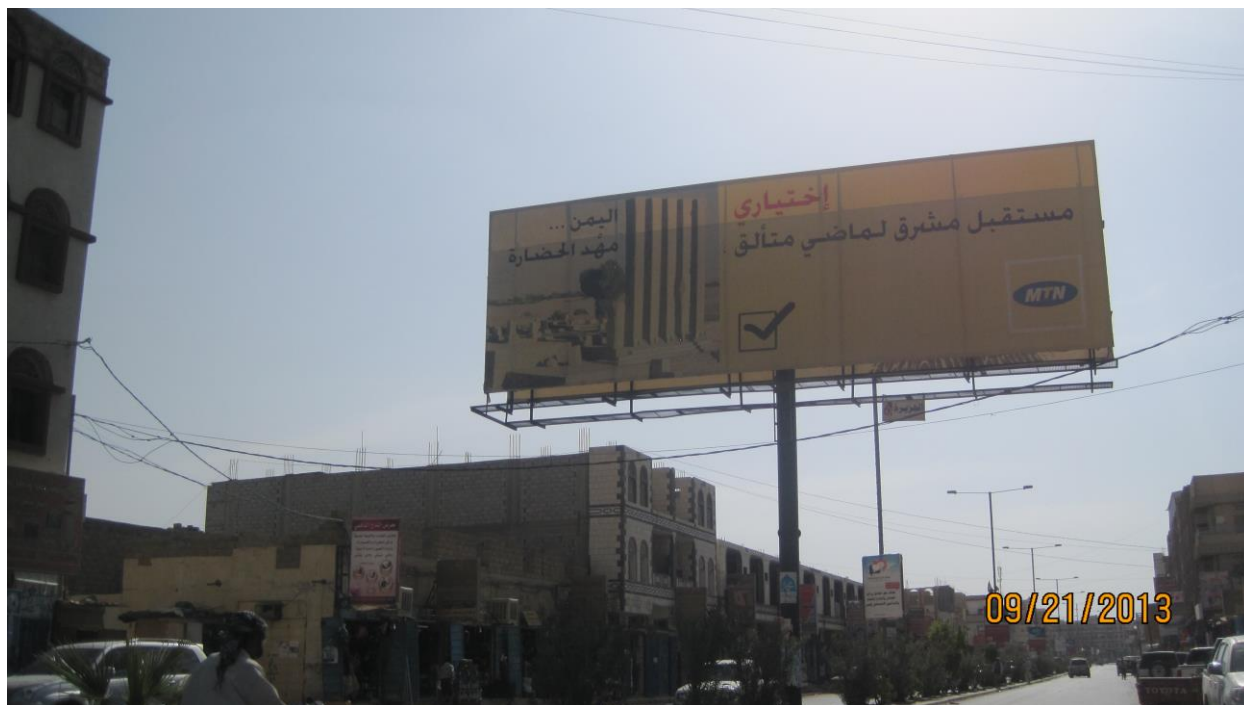
Magaalada Ma'rib\مأرب. Xasanwali Sabti 15 Shawwaal\شوال 1434 H - 09/21/2013M.