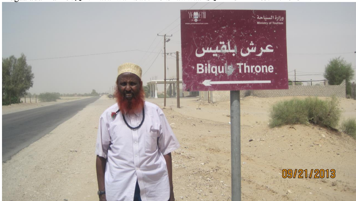
Carshiga Bilqiis\بلقيس عرش ee Ma'rib\مأرب ee arliga Yaman\اليمن. Xasanwali Sabti 15 Shawwaal\شوال 1434 H - 09/21/2013M..