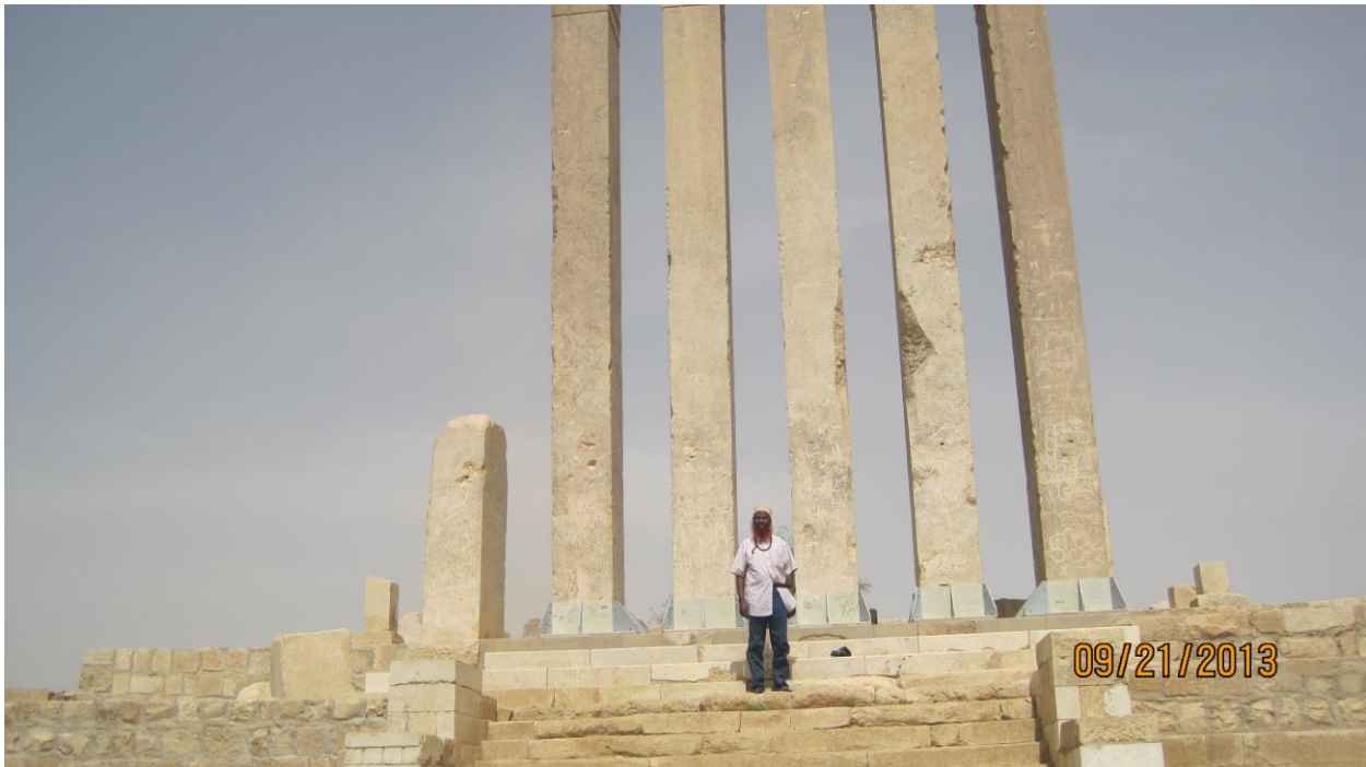
Anigoo taagan Carshiga Bilqis\عرش بلقيس ee magaalada Ma'rib\مأرب ee arliga Yaman\اليمن. Xasanwali Sabti 15 Shawwaal\شوال 1434 H - 09/21/2013M.