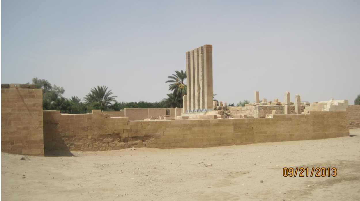
Carshiga Bilqis\عرش بلقيس ee Ma'rib\مأرب ee arliga Yaman\اليمن. Xasanwali Xasanwali Sabti 15 Shawwaal\شوال 1434 H - 09/21/2013M.