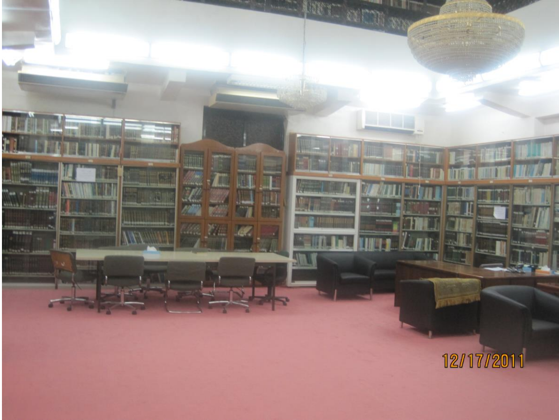
Guriguu ku dhashay Sallaa Allaahu Calayhi Wa Calaa Aalihi Wa Sallam gudihisa maanta. Xasanwali 1433H./2011M.