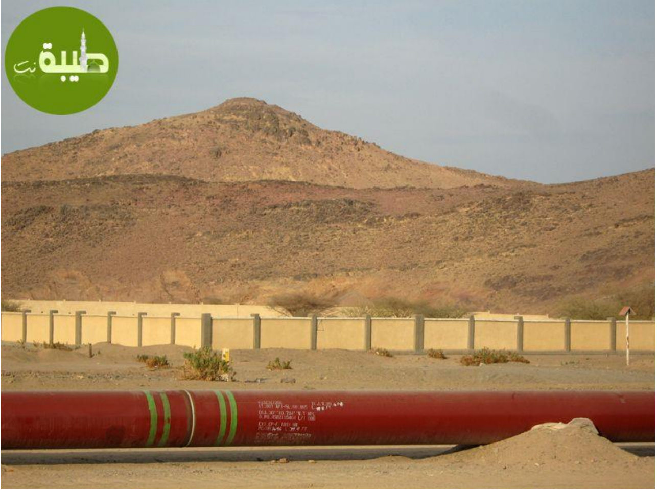
سور المقبرة من الخارج